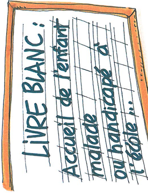
L'accueil de l'enfant malade chronique ou handicapé à l'école • Livre blanc